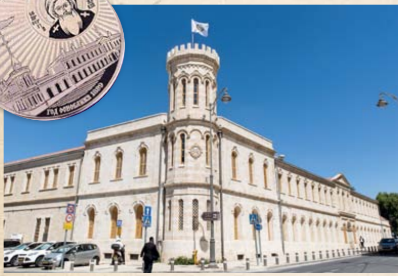
Сергиевское подворье. Современный вид. Медаль по эскизу Игоря Ашурбейли, выпущенная к возобновлению деятельности подворья