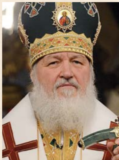
Кирилл, Патриарх Московский и всея Руси, Председатель Комитета Почётных членов Императорского Православного Палестинского Общества