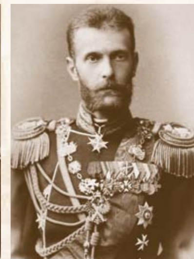
Великий князь Сергей Александрович Романов, первый Председатель Императорского Православного Палестинского Общества, 1889-1905 гг