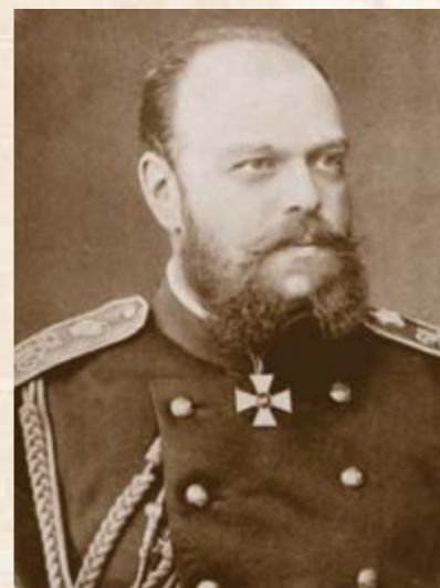
Российский Император Александр III, утвердивший Устав Православного Палестинского Общества 3 июня 1882 года