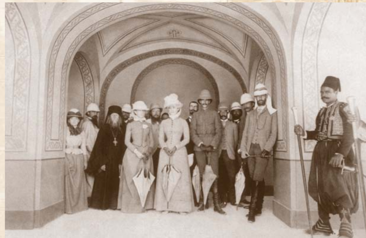
Великие князья Сергей Александрович, Павел Александрович и Великая княгиня Елизавета Фёдоровна во время паломничества в Иерусалим в 1888 году.