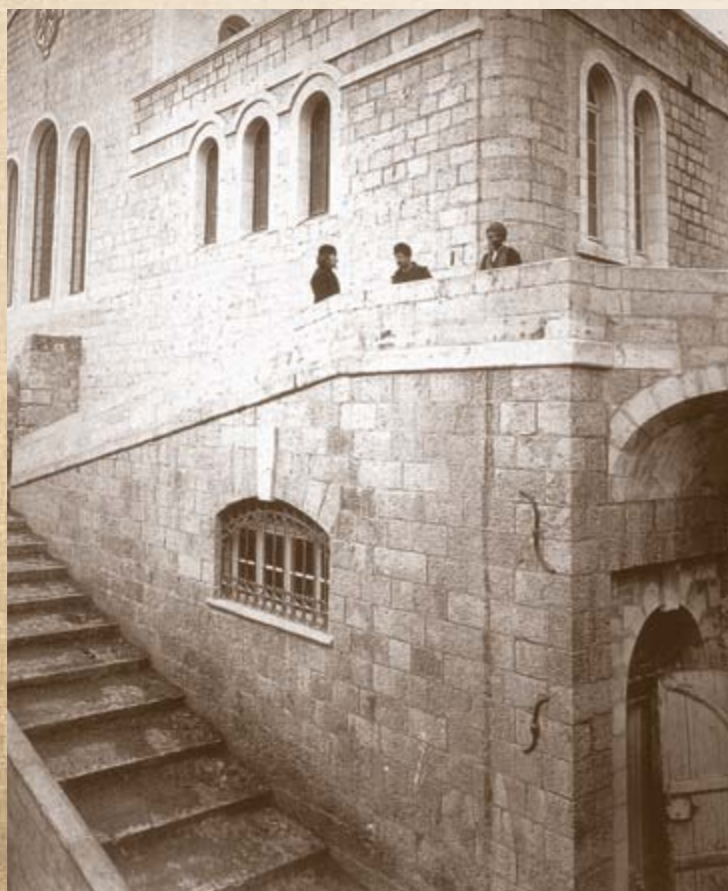
Фасад церкви на Александровском подворье в Иерусалиме. Фото начала XX века

Носящее имя основателя и первого Председателя Палестинского Общества, Великого князя Сергея Александровича, подворье вместило в свою историю судьбу не только построившего его Общества и всего многогранного русского наследия в Святой Земле, но и императорской России.