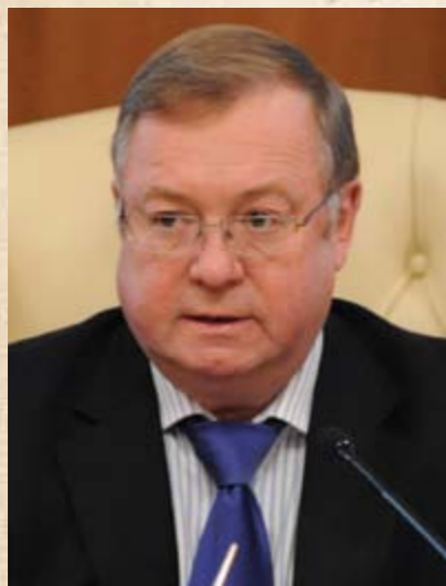
Сергей Степашин, ныне действующий Председатель Императорского Православного Палестинского Общества