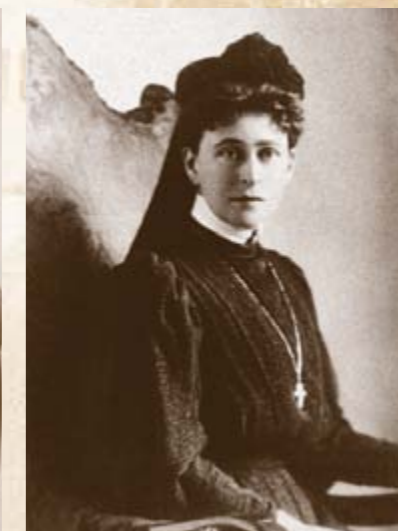
Великая княгиня Елизавета Фёдоровна Романова, второй Председатель Императорского Православного Палестинского Общества, 1905-1917 гг