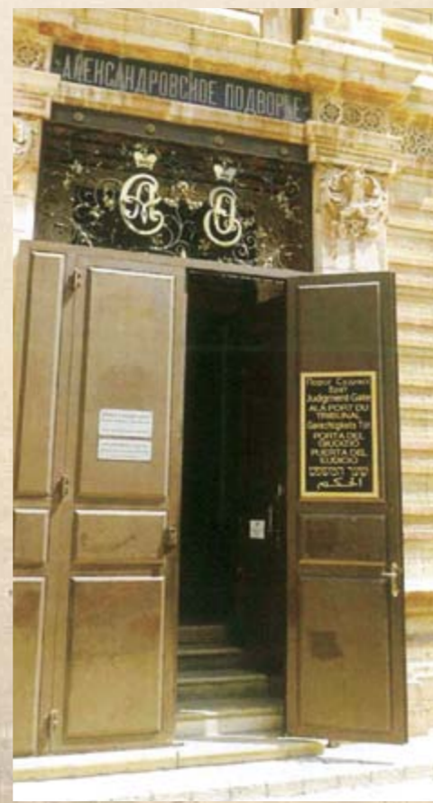
Парадный вход в Александровское подворье в Иерусалиме. Современный вид