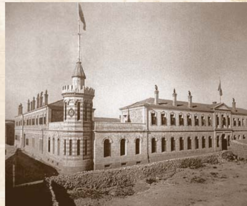
Сергиевское подворье в Иерусалиме с флагом ИППО в 1889 году.