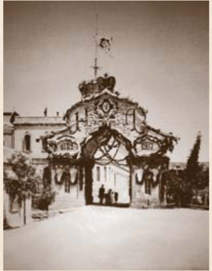
Флаг ИППО и праздничный вазель Императору Николаю II в 25-летие юбилея ИППО в Иерусалиме в 1907 году. 1907 г.

Успешными строительными и научно-археологическими проектами Общество быстро смогло завоевать общественное и государственное признание. Высочайшим Указом от 24 марта 1889 г. ему были переданы все полномочия, имущество и капиталы, связанные с русским присутствием в Святой Земле, и оно получило почётное именование Императорского Православного Палестинского Общества.