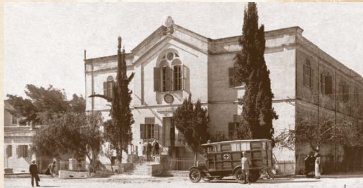
Русская больница в центре западного Иерусалима, построенная в период создания комплекса Русских построек на Мейдамской площади усилиями Палестинского комитета с 1859 по 1864 гг.

В 1989 г. в Общество пришли новый Председатель – ректор Дипломатической академии, Чрезвычайный и Полномочный Посол РФ – О. Г. Пересыпкин и учёный секретарь В. А. Савушкин. Именно в этот период произошли ключевые для ИППО события: Общество получило самостоятельность, вернуло своё историческое название, стало работать по новому Уставу, максимально приближенному к первоначальному, восстановило свои основные функции, в том числе содействия православному паломничеству. Члены ИППО активно участвовали