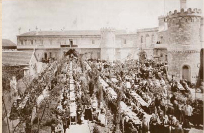
Пасхальное разговение во дворе Сергиевского подворья Императорского Православного Палестинского Общества в Иерусалиме. Конец XIX века