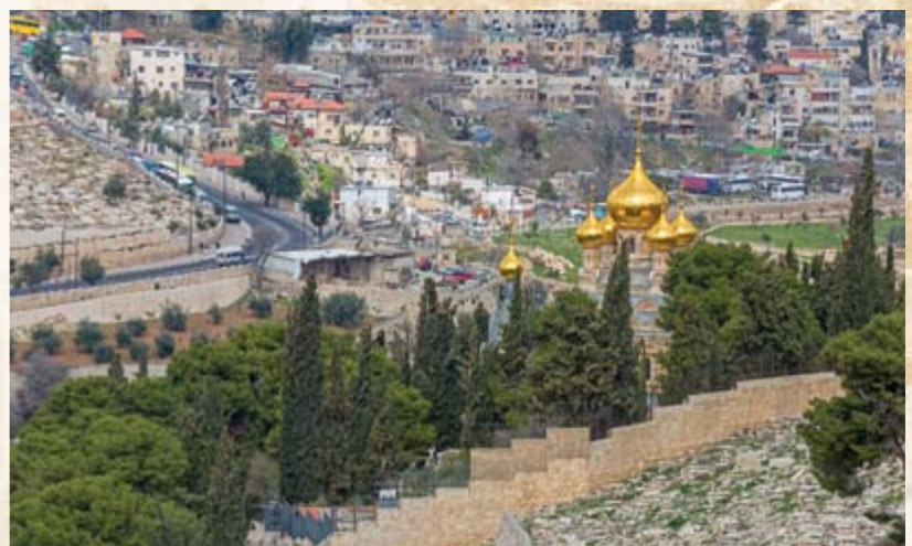
Храм Святой равноапостольной Марии Магдалины, построенный в Иерусалиме на средства императорской семьи Романовых

Поскольку по турецкому законодательству (отсутствие права земельной собственности у юридических лиц – учреждений и обществ) Палестинское Общество не могло иметь на Востоке собственной юридически оформленной недвижимости, треть участков была закреплена за русским правительством, остальные оформлялись как частная собственность. Со временем планировалось добиться у Османского правительства правильного закрепления недвижимостей Общества, но помешали Первая мировая война и революция, которые прервали на взлёте русскую гуманитарную деятельность на Ближнем Востоке.