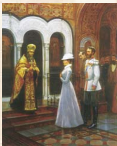
Великий князь Сергей Александрович и Великая княгиня Елизавета Фёдоровна на освящении храма Св. Марии Магдалины в Иерусалиме в 1888 г.

В Обществе состояло к этому времени более 3 тыс. членов, недвижимое имущество Общества составляли 28 земельных участков (26 в Палестине и по одному в Ливане и в Сирии), общей площадью более 23.5 гектара.