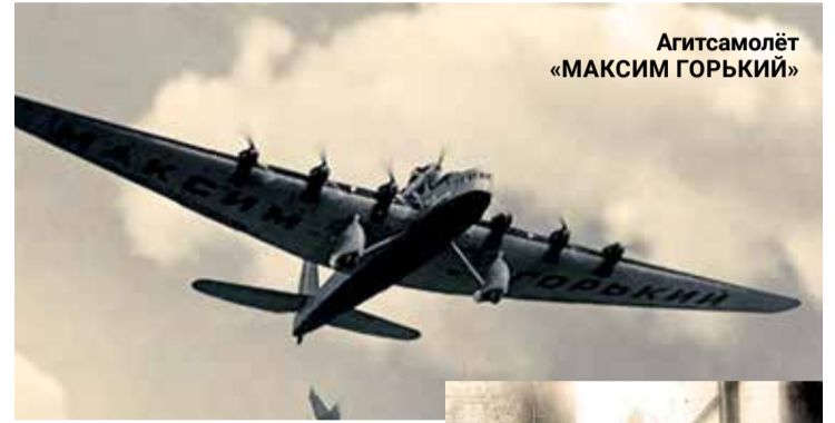
Агитсамолёт «МАКСИМ ГОРЬКИЙ»

18 мая 1935 года на территории знаменитого посёлка художников упали обломки самого большого в мире самолёта АНТ-20, носившего имя пролетарского писателя. Агитсамолёт «Максим Горький» развалился на части в небе над Соколом. Как и в случае с «Титаником», эксперты считали его очень надёжной машиной. Как и «Титаник», его создавали с расчётом на то, чтобы впечатлить весь мир.