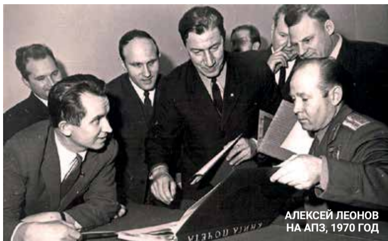
АЛЕКСЕЙ ЛЕОНОВ НА АПЗ, 1970 ГОД

18 марта 1965 года советский лётчик-космонавт Алексей Леонов совершил исторический выход в космическое пространство. А 28 февраля 1970 года космонавт побывал в Арзамасе.