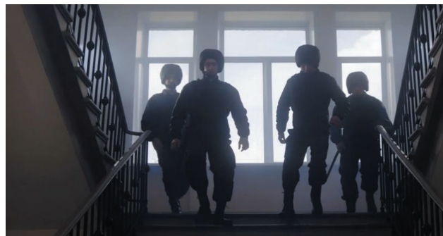
Кадр из имиджевого ролика к 35-летию холдинга с участием сотрудников ЧОП «ВПК-Безопасность»

подстраховки, на совмещение обязанностей ни у кого просто не хватило бы сил. И я желаю нам это сохранить!