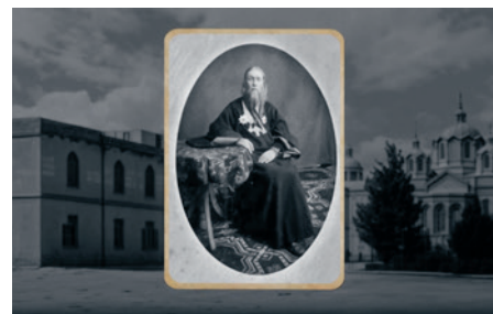
Кадр из фильма «Антонин Капустин — создатель Русской Палестины». Кинокомпания «Студия Икона», 2025 год

Премьера документального полотна вернула в общественное сознание образ великого соотечественника, наглядно продемонстрировав живую связь времён и продолжающиеся традиции русского присутствия на Святой Земле.